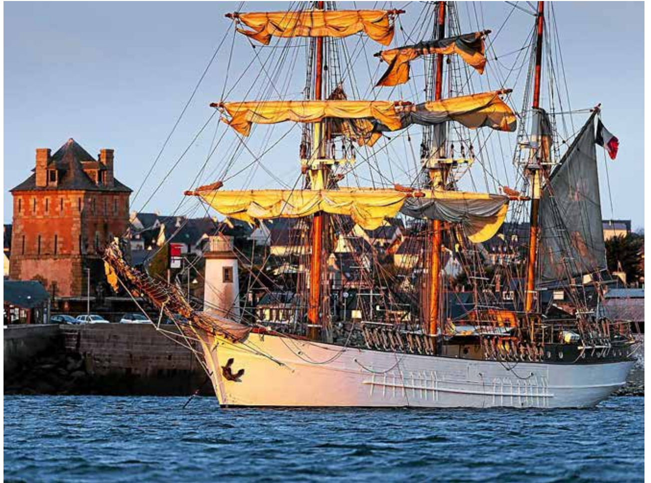
Le soutien d'une vingtaine de mécènes a permis de financer l'accueil de 2 600 jeunes et adultes, en 2023, à bord du Français, ici au mouillage devant le port de Camaret. Ewan Lebourdais

« Solidarité, bienveillance et transmission. Ce projet permet de tendre la main aux jeunes et aux moins jeunes, à tous ceux qui veulent aussi, à un moment de leur vie, prendre une autre direction ».